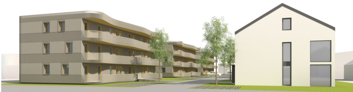
Bebauung aus der Perspektive vom Riedweg

Zur weiteren Entlastung des Mietwohnungsmarktes plant die Stadt zusammen mit der Hoffnungsträger Stiftung die Bebauung des ca. 0,62 ha großen Areals neben dem Friedhof, zwischen Steinenbacher Weg und Riedweg.