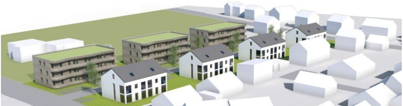
Perspektive aus Süd-West

Seit mehreren Jahren bemüht sich die Stadtverwaltung, der Gemeinderat und eine Gruppe engagierter BürgerInnen um die Schaffung von bezahlbarem Wohnraum in Aulendorf. Auch bei der letzten Kommunalwahl in 2019 wurde deutlich, dass bezahlbarer Wohnraum für viele Familien in Aulendorf ein sehr wichtiges Thema ist.